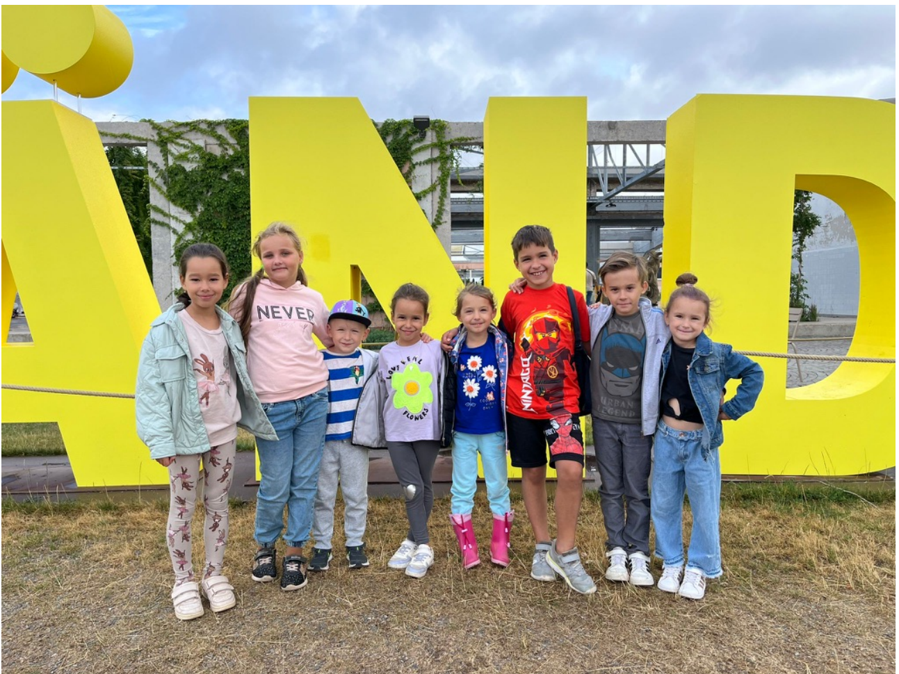
Ausflug im Rahmen „FiB-Ferienaktion“ zur Buga 2023 in Mannheim

Mit diesen Unterstützungen und Projektförderungen war und ist es uns möglich, hoffnungsvoll in die Zukunft zu blicken, um weiter für Familien vor Ort Ansprechpartner zu bleiben und unsere Angebote bedarfsgerecht auszubauen bzw. weiterzuentwickeln.